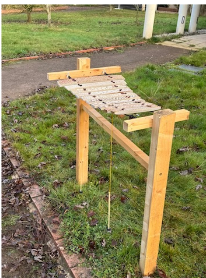
ADAPEI 35 (Vitré - 35)

Vous pourrez relier les lames entre elles pour suspendre votre instrument dans un arbre, entre deux arbres tel un hamac, entre deux piquets, ... ou créer un support mobile. Tutoriel vidéo de montage des lames fourni.