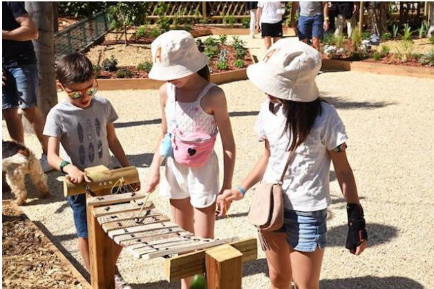
Jardin des sens - Le Lavandou (Le Var - 83)