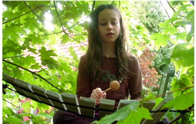
Dans un arbre

Vous pourrez relier les lames entre elles pour suspendre votre instrument dans un arbre, entre deux arbres tel un hamac, entre deux piquets, ... ou créer un support mobile. Tutoriel vidéo de montage des lames fourni.