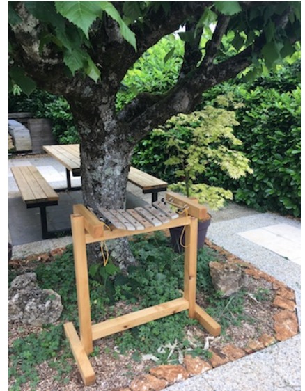
Chez un particulier

4 crochets à visser, cordages, une paire de baguettes spéciales extérieures, tutoriel de montage.